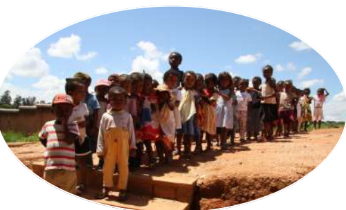
TSIROANOMANDIDY 82 enfants

6 écoles et cantines scolaires, 3 centres nutritionnels, 2 dispensaires, 1 ferme de spiruline