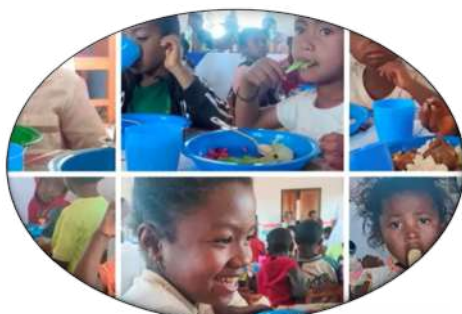
ANKADINONDRY-SAKAY * 80 enfants