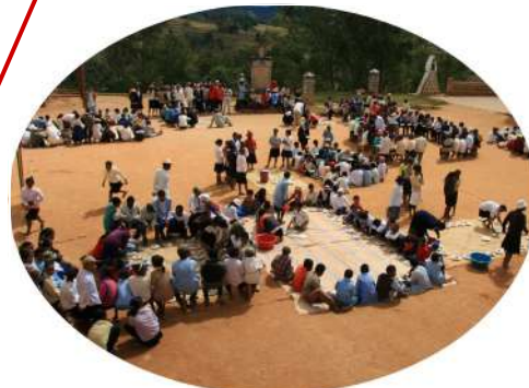
IMITO 938 enfants