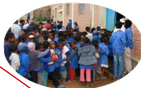
IMADY 680 enfants