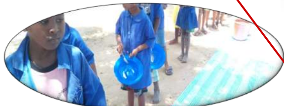
BEKOPAKA * 180 enfants