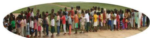
AMBOHIPENO 110 enfants