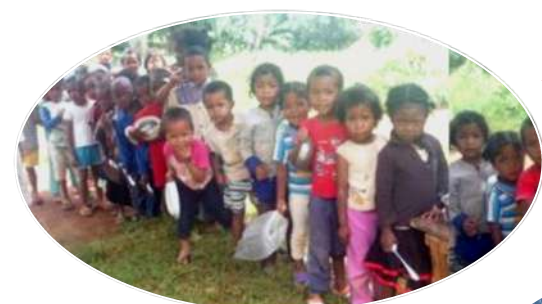
ANTSONGO * 1132 enfants