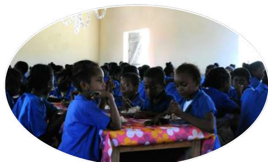
MAHAMBO * 402 enfants