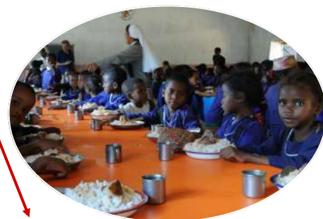
AMBINANINDRANO * 478 enfants

* Cantines en partenariat avec les associations Para Los Niños, Quebracho ou Alegria