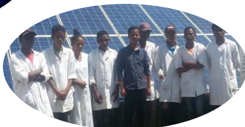
Ferme de spiruline FANANTENANA (à Vohijanahary près d'Antsirabe) 4 700 enfants bénéficiaires (avec d'autres associations)