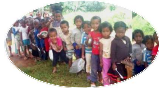
Cantine scolaire d'ANTSONGO 847 enfants