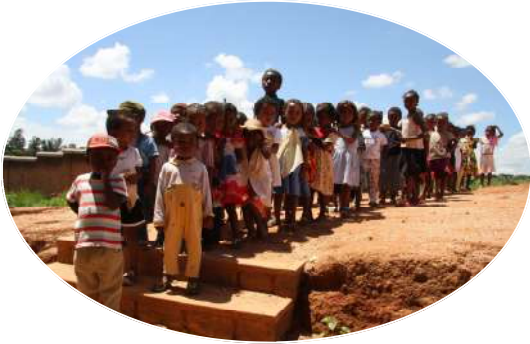
Cantine de TSIROANOMANDIDY 82 enfants