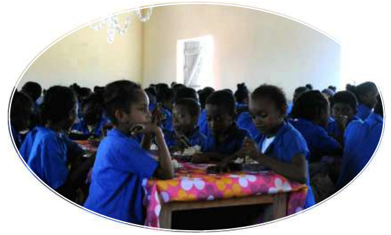
Cantine scolaire de MAHAMBO 290 enfants