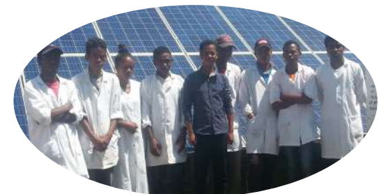
Ferme de spiruline FANANTENANA 4 350 enfants bénéficiaires (avec d'autres associations) 1,2 tonne de spiruline distribuée