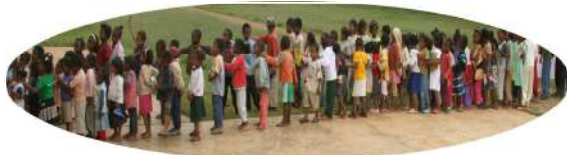
Cantine d'AMBOHIPENO 110 enfants