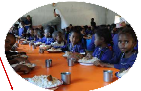
Cantine scolaire d'AMBINANINDRANO 300 enfants