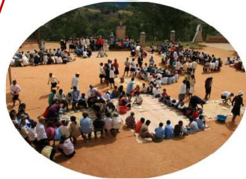
Cantine scolaire d'IMITO 868 enfants