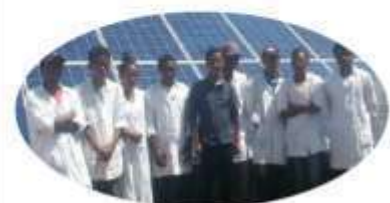
Ferme de spiruline FANANTENANA 4 350 enfants bénéficiaires (avec d'autres associations) 1,2 tonne de spiruline distribuée