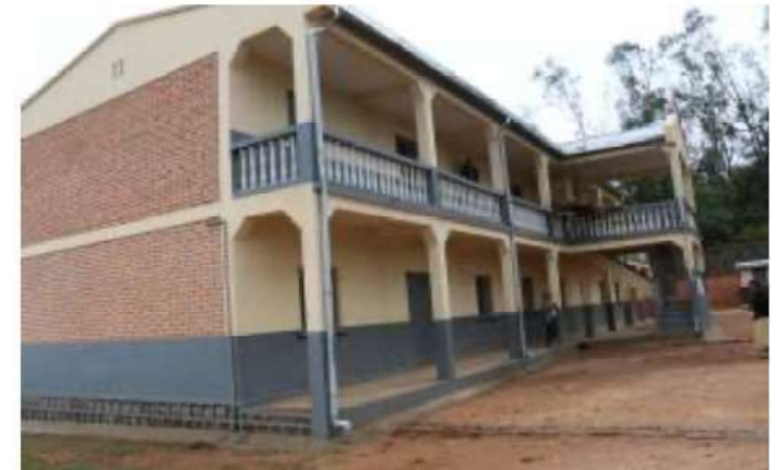
Le bâtiment du lycée