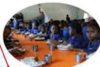
Cantine scolaire d'AMBINANINDRANO 300 enfants