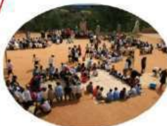
Cantine scolaire d'IMITO 868 enfants