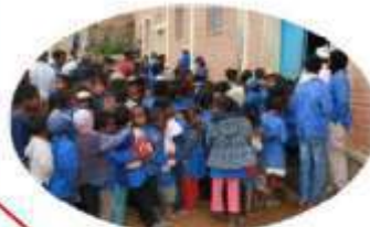
Cantine scolaire d'IMADY 378 enfants