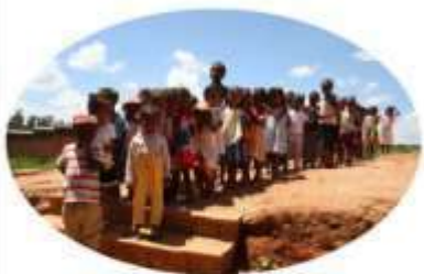
Cantine de TSIROANOMANDIDY 82 enfants