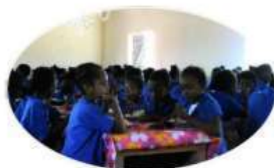
Cantine scolaire de MAHAMBO 290 enfants