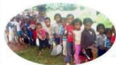
Cantine scolaire d'ANTSONGO 847 enfants