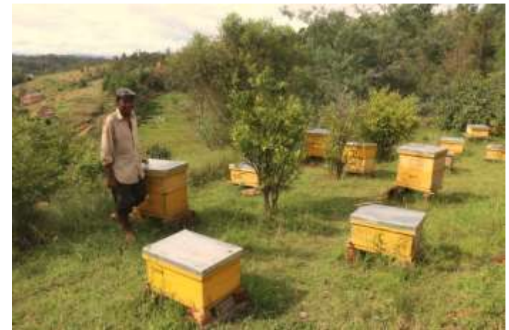
Les ruches d'Imito financées grâce aux AGR

-----La parole est à sœur Nory en direct d'Imito-----