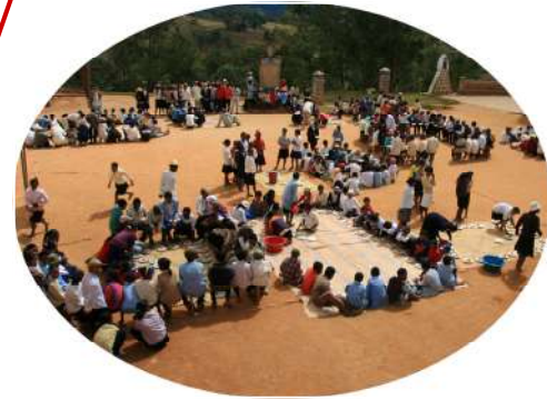
Cantine scolaire d'IMITO 820 enfants