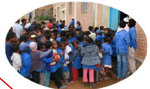
Cantine scolaire d'IMADY 360 enfants