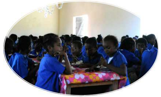
Cantine scolaire de MAHAMBO 260 enfants