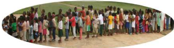
Cantine d'AMBOHIPENO 110 enfants