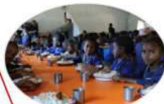
Cantine scolaire d'AMBINANINDRANO 300 enfants